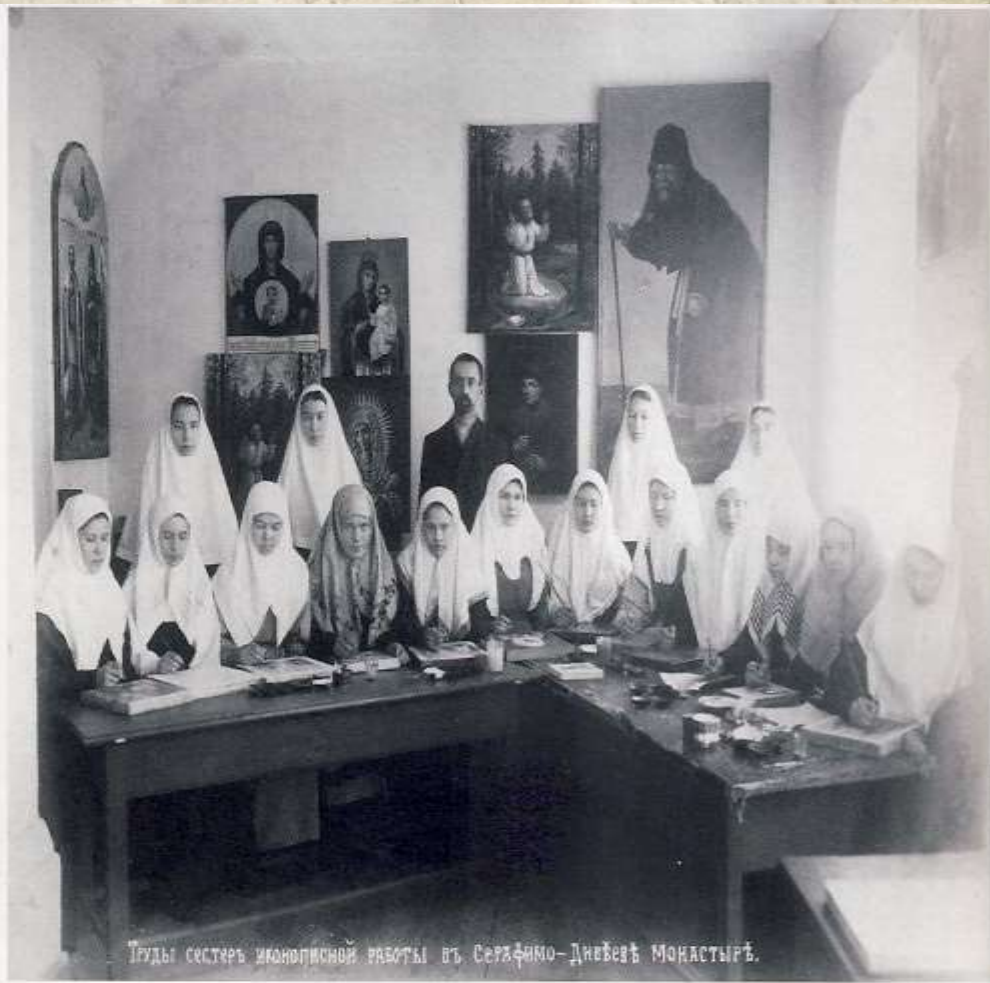
Труды сестер иконописной работы в Серафимо-Дивеевском монастыре.

Иконописная мастерская. Конец 1900-х годов.