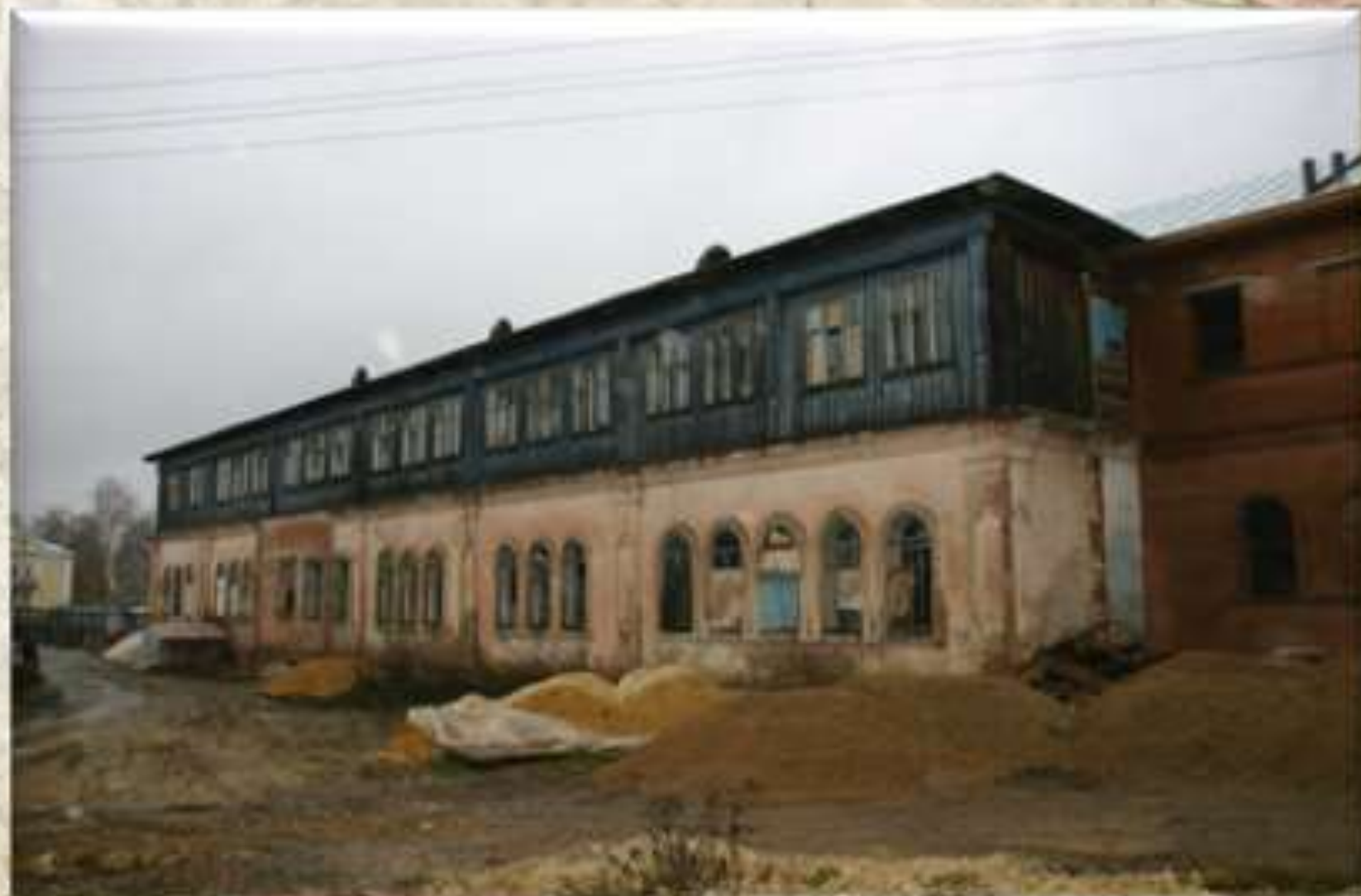
Здание литографии. 2005г.