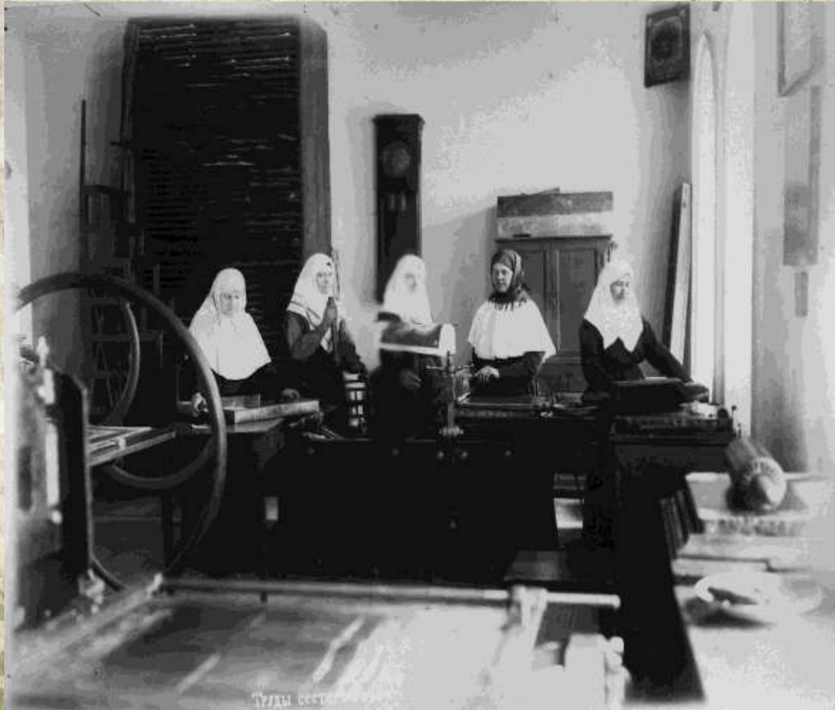
Труды сестер метамохромотипии.