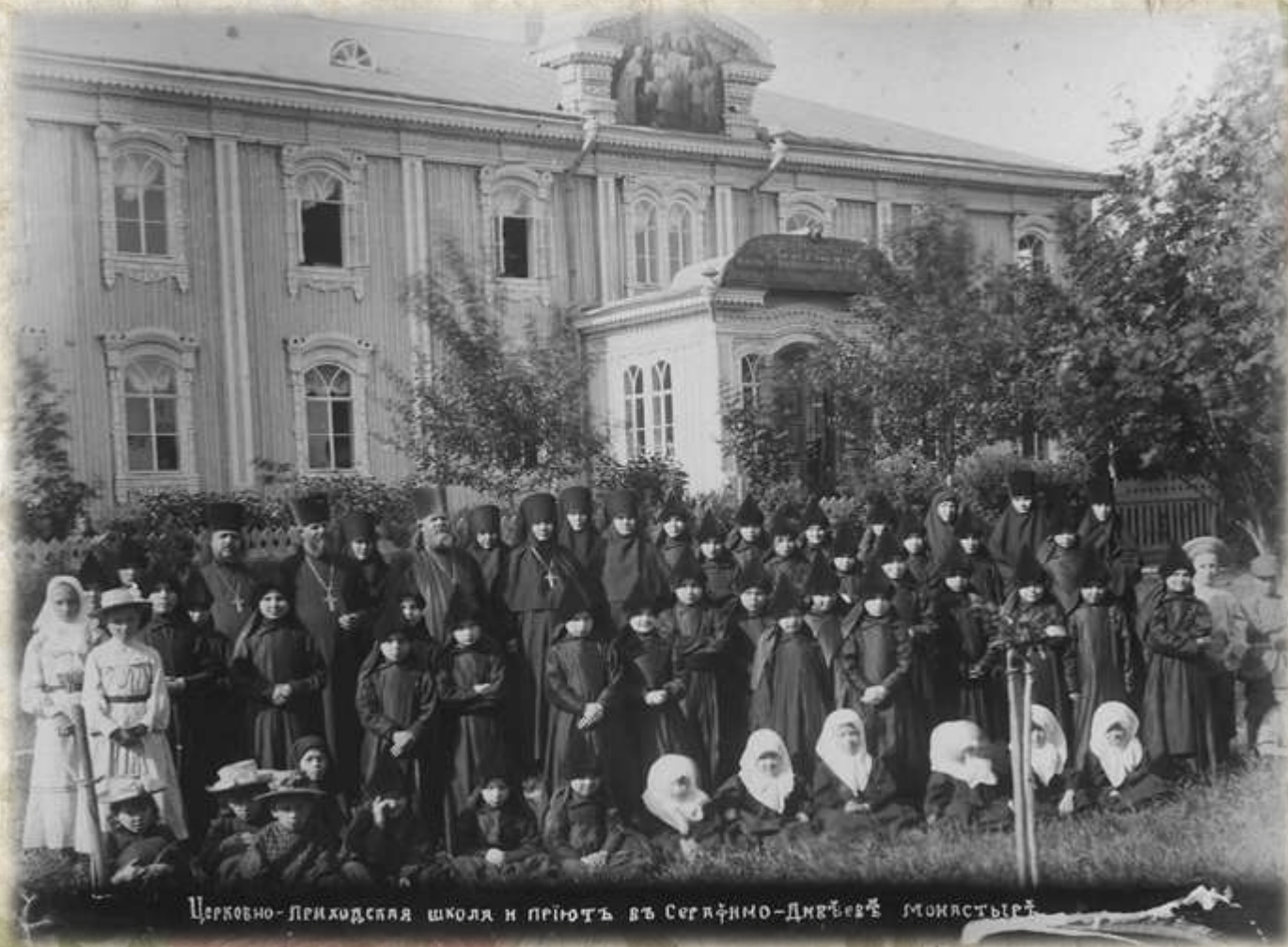
Церковно-приходская школа и приютъ въ Сергѣино-Дивѣевѣ монастырѣ

Школа-приют была под особым покровительством Императрицы Александры Фёдоровны и поэтому назывался «Александринским». Она на содержание школы присыла средства.