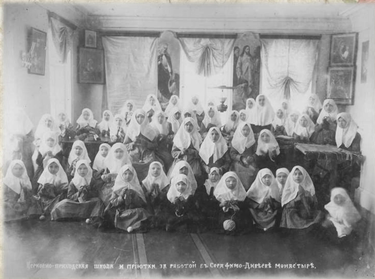
Церковно-приходская школа и пріютки за работой въ Сергѣево-Дивѣевѣ монастырѣ.

В приюте была 4-х классная школа. Преподавали сёстры и духовенство. В свободное время от занятий девочки занимались и учились всякому рукоделию: вязать, шить, также учились петь и играть на фисгармонии.