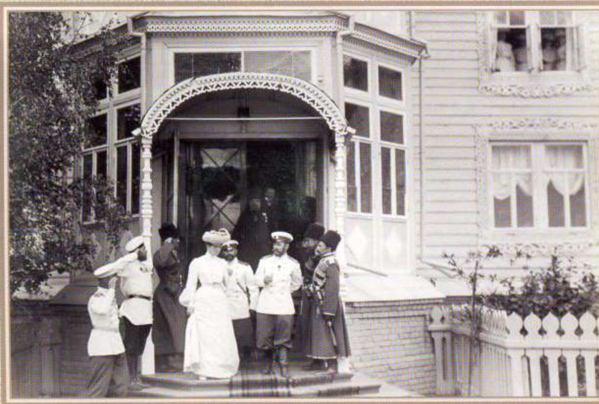
Встреча Царской Четы у Троицкого собора Серафимо-Дивеевского монастыря. 20 июля

Император выходит из игуменского корпуса в Дивеево. 20 июля