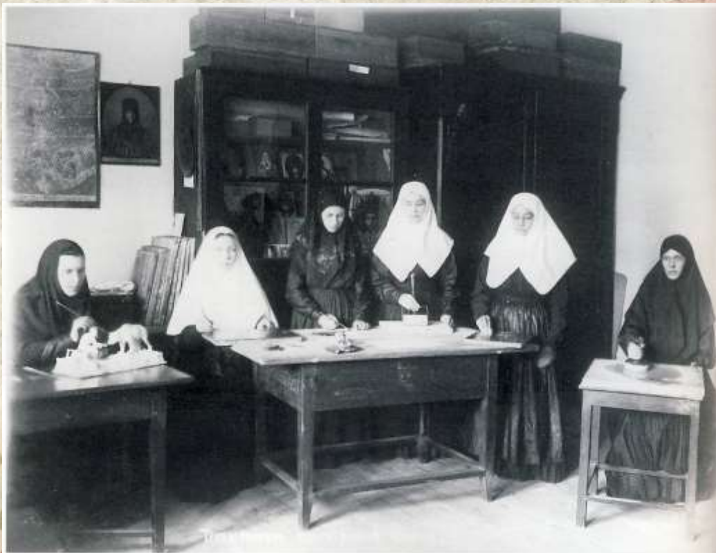
Монахини за работой. Расписывания фигурок.