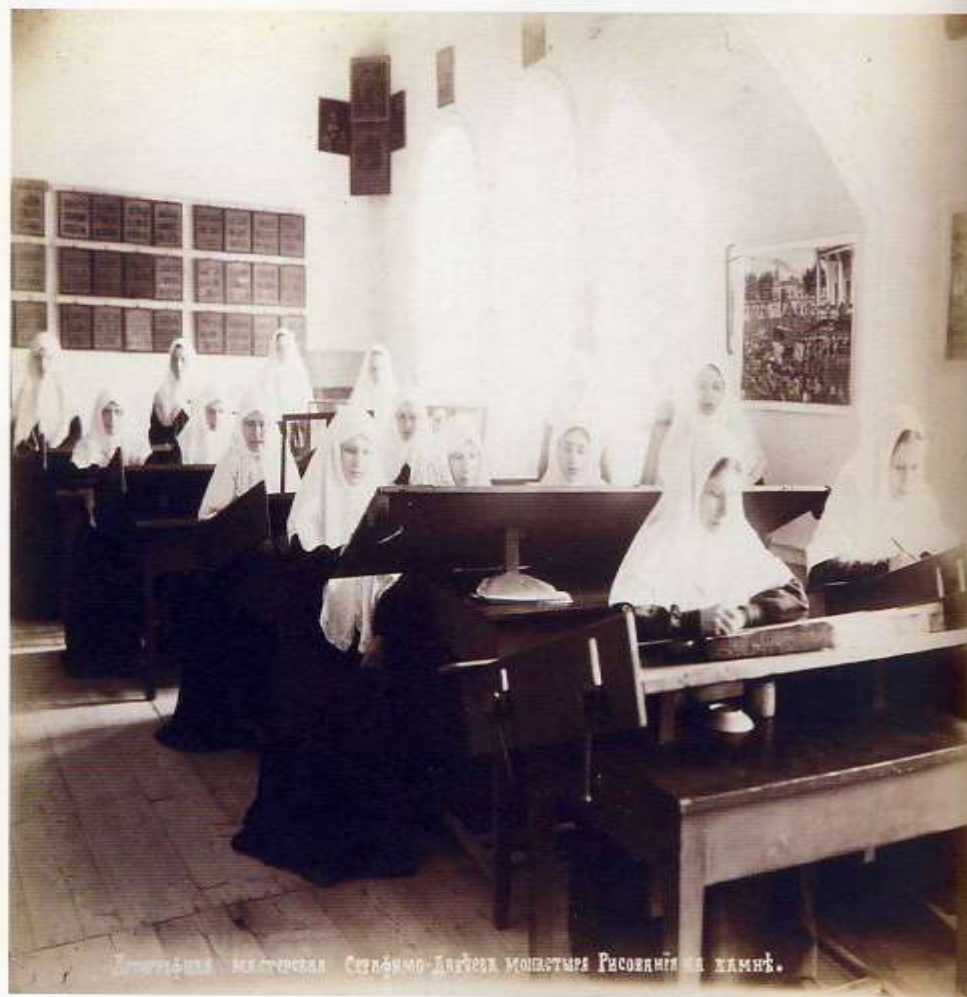
Литографическая мастерская Серафимо-Дивеевского монастыря. Рисование на камне.

Литографическая рисовальная мастерская Серафимо-Дивеевского монастыря. Конец 1900-х гг. Фотография. Серафимо-Дивеевский Троицкий женский монастырь