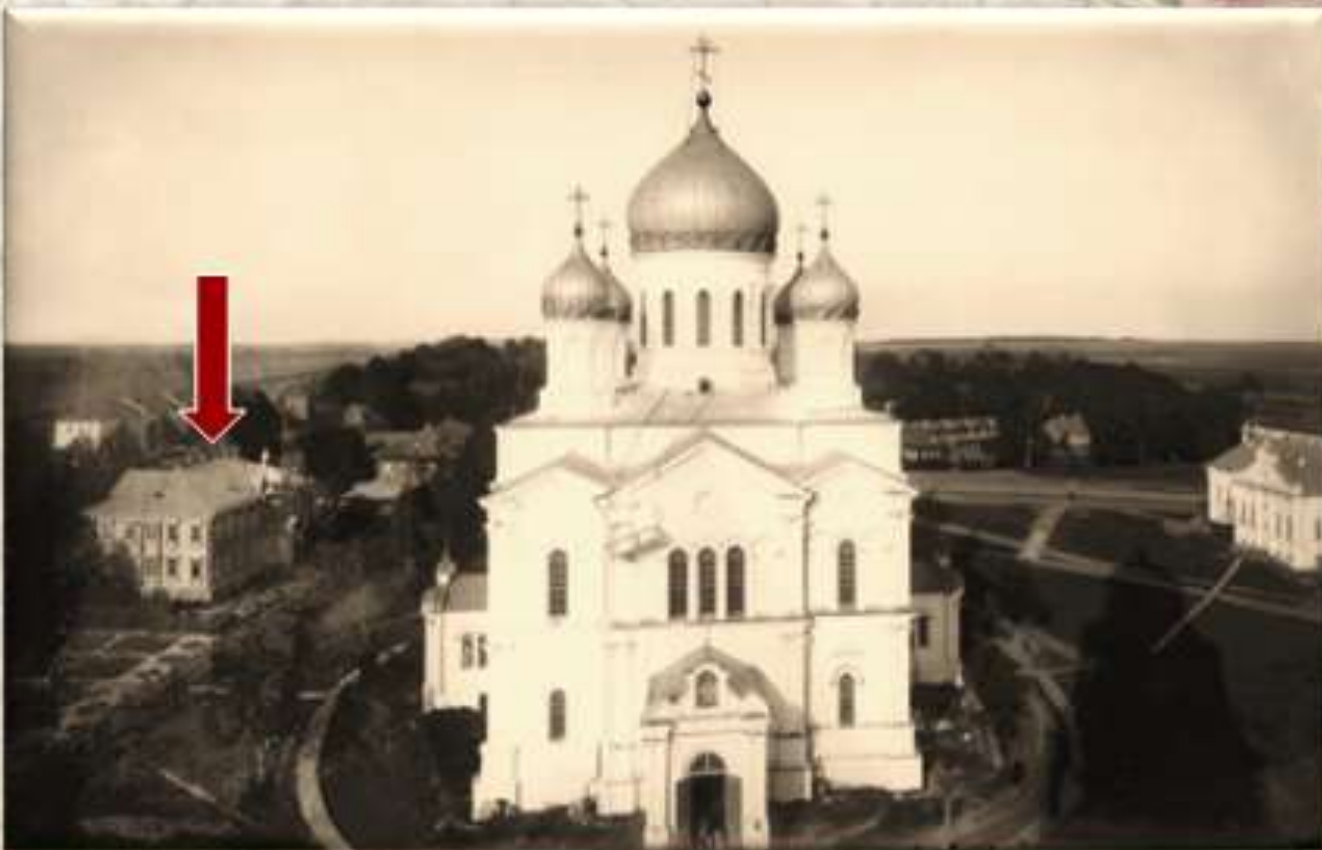
Троицкий собор. Слева от него – здание школы-приюта. Фото 1907 года.

При Серафимо-Дивеевском монастыре были устроены особенные помещения для учениц с нарочитыми Наставницами и воспитанницами и официально утверждено церковно-приходская школа-приют.