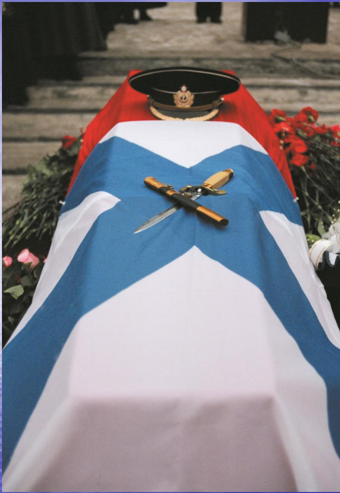
Под сенью Андреевского флага.