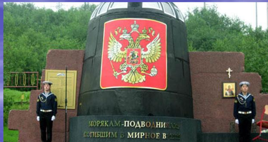
Мурманск. Рубка АПЛ Курск