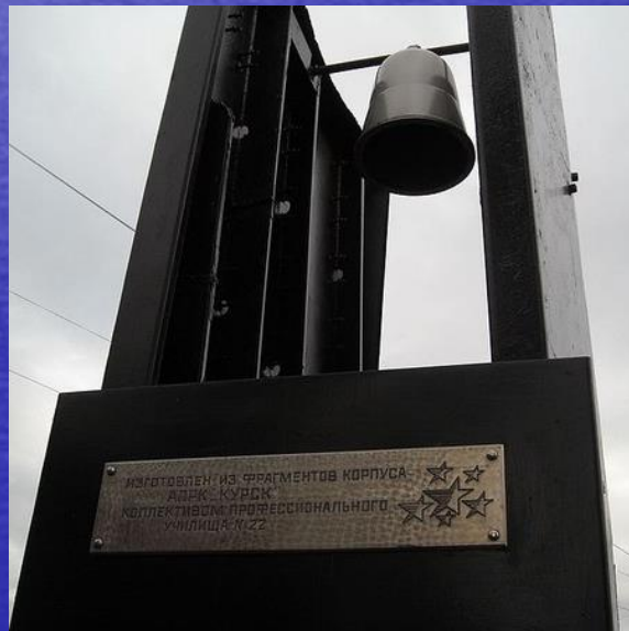
Изготовлен из фрагмента корпуса АПРК Курск. Курск.