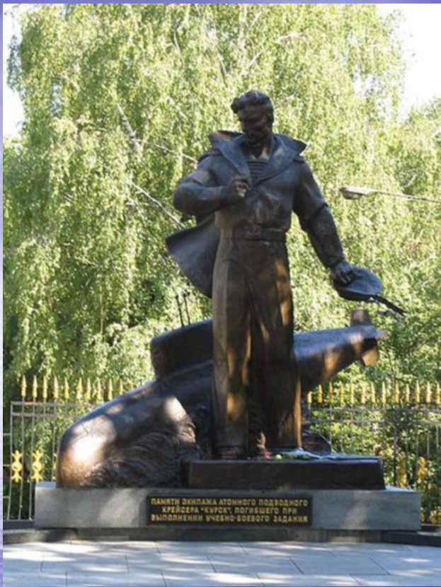
Москва. Памятник погибшим подводникам.