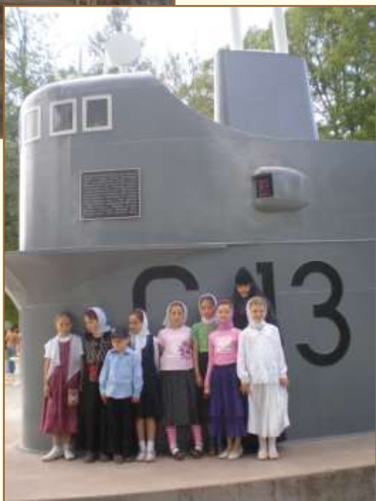
Нижний Новгород. Кремль. Рубка подводной лодки С-13.