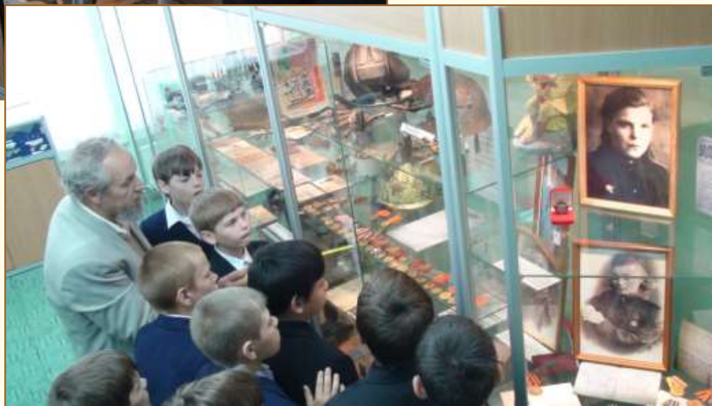
Дети в школьном музее.