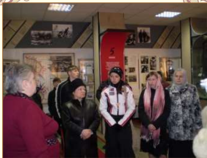
Курск. Командный пункт Центрального фронта