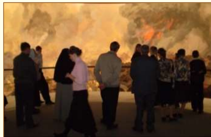
Белгород.. Музей-диорама "Огненная дуга"