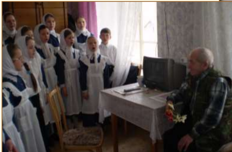
Посещение Дома милосердия.