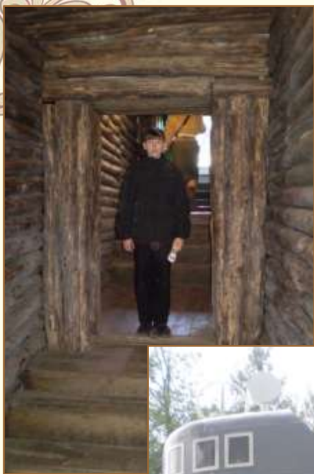
Курск. В блиндаже К.К. Рокоссовского