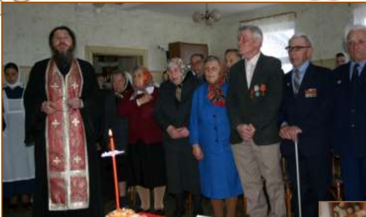
Заупокойная лития в День Победы. Молитва о погибших.