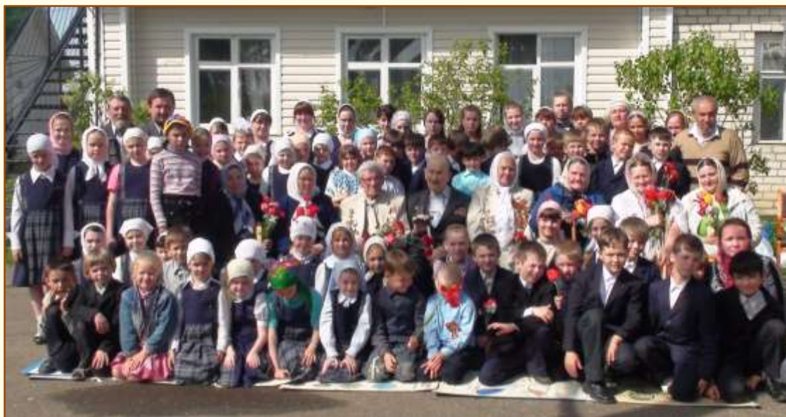
Фотография на память. День Победы 2012 года.