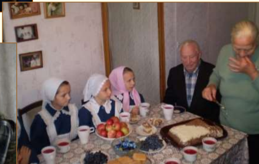
Поздравление с юбилеем ветеранов войны.