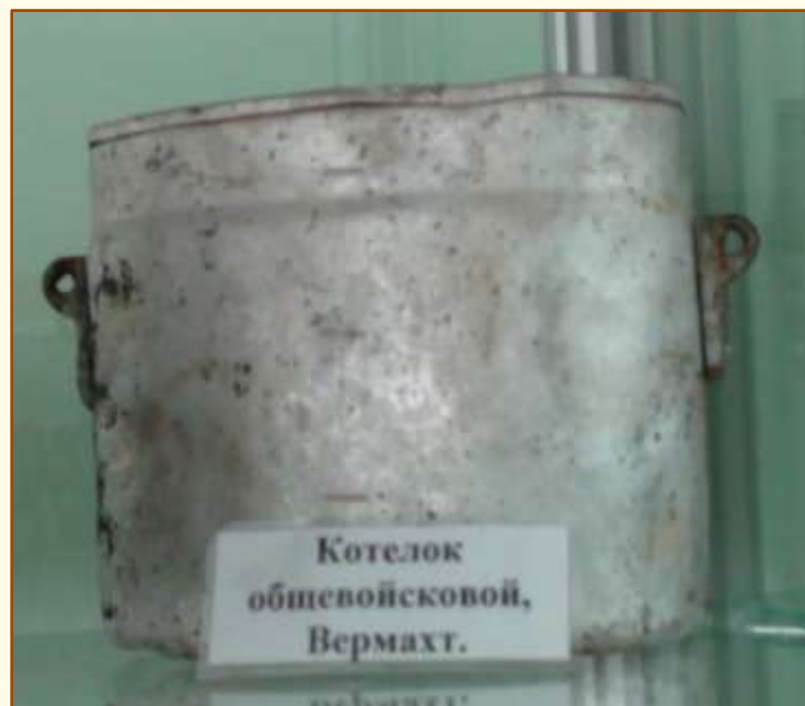
Котелок общевойсковой, Вермахт.