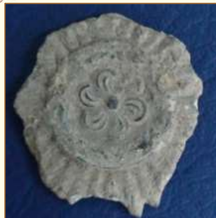
Фрагмент знака отличия для восточных народов «За заслуги» 2-го класса