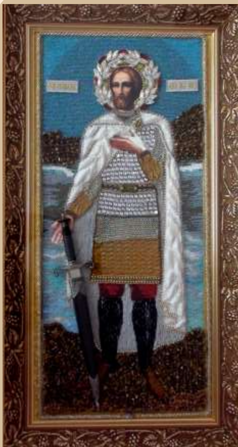
Школьная икона св. благоверного князя Александра Невского

В годы Великой Отечественной войны 1941 – 1945 годов был учрежден боевой орден Александра Невского, которым награждали офицеров за личную отвагу, мужество и храбрость, умелое командование. Личность Александра Невского вызывала и вызывает к себе неослабевающее внимание не только историков, но и писателей, публицистов и вообще людей, размышляющих о судьбах России.