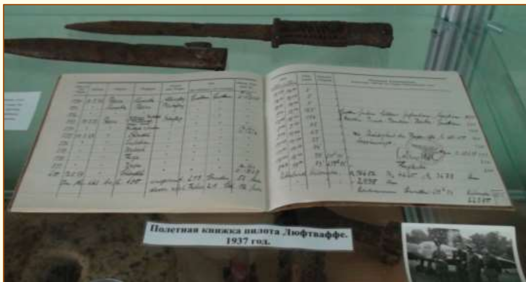
Полетная книжка пилота Люфтваффе. 1937 год.